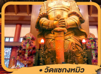
• วัดแซงหมิว