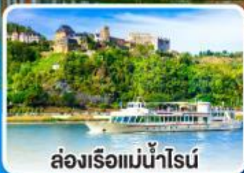
ล่องเรือแม่น้ำไรน์