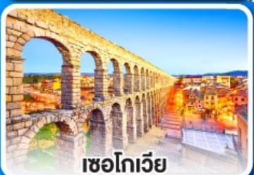
เซโกเวีย