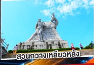
สวนกว้างหลิวหลัง