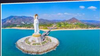
วัดเจ้าแม่กวนอิมหกลกซาม