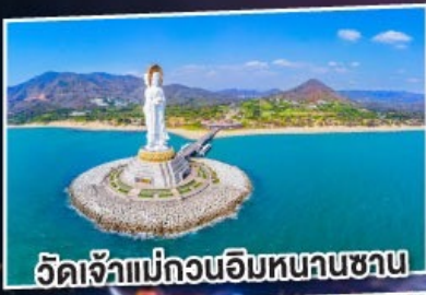
วัดเจ้าแม่กวนอิมหนานซาน