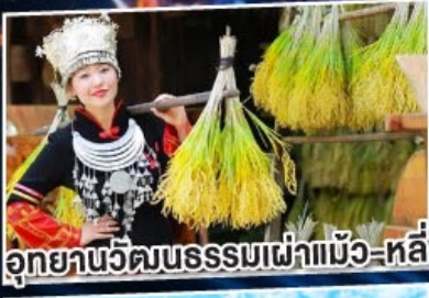
อุทยานวัฒนธรรมเผ่าแม้ว-หลี