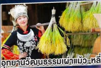
อุทยานวัฒนธรรมเผ่าแม้ว-หลี