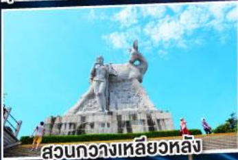
สวนกว้างเหลียวหลิง