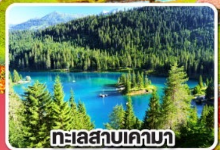
ทะเลสาบเคามา

เกาะดอกไม้ รถไฟธรรมชาติและมหาน้ำแข็ง สวิตเซอร์แลนด์ เยอรมนี 8 วัน 5 คืน