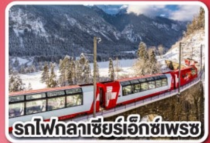
รถไฟกลาเซียร์เอ็ทซ์เพรช