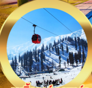
เคเบิลคาร์ กุลมาร์ค