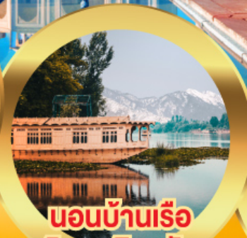
นอนบ้านเรือ วิวเขาหิมาลัย