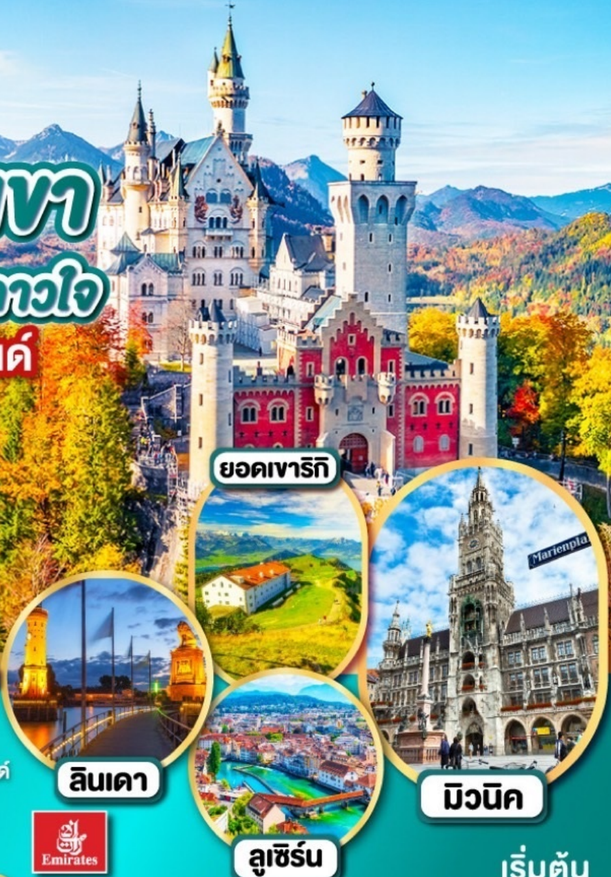
ยอดเขารีกี