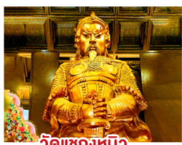
วัดแควงหมิว