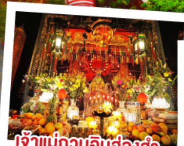
เจ้าแม่กวนอิมฮ่องฮำ