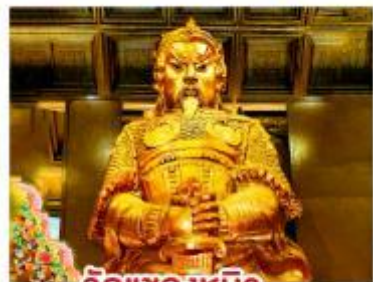
วัดแชกงหมิว