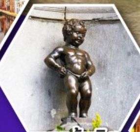
แมนเกินฟิส