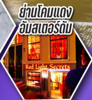
ย่านโคมแดง อัมสเตอร์ดัม

ตะลุยอัมสเตอร์ดัม ทั้งจตุรัสดามสแควร์ และย่านโคมแดง (Red Light) ราคาเริ่มต้น