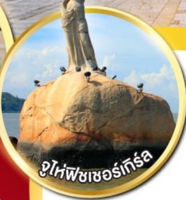
จูไห่พีชเชอร์เกิร์ล