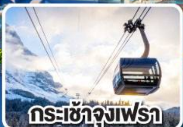
กระเช้าจุงเฟรา

เข้าแวร์ซายน์ เทียวลูเซิร์น เดินเพลินๆ เดินไปสอยโป ฝรั่งเศสและสวิตเซอร์แลนด์ 8 วัน 5 คืน