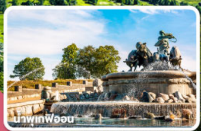
น้ำพุเทพอู

พักค้างคืนเรือสำราญ DFDS พร้อมมื้ออาหาร Scandinavian Buffet