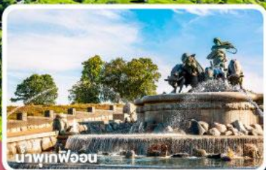
น้ำพุเทพีอ้อน