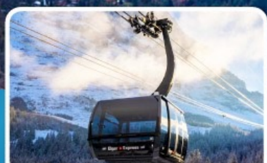
กระเช้า ไอเกอร์เอ็กสเพรส สู่จุงเฟรา

อิตาลี สวิตเซอร์แลนด์ ฝรั่งเศส 10 วัน 7 คืน