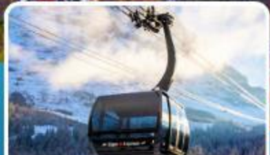
กระเช้า ไอเกอร์เอ็กสเพรส สู่อยอดเขาจุงเฟรา