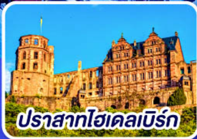
ปราสาทไฮเดลเบิร์ก