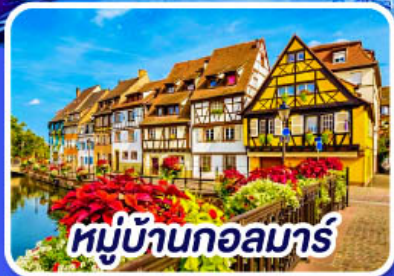
หมู่บ้านกอลมาร์