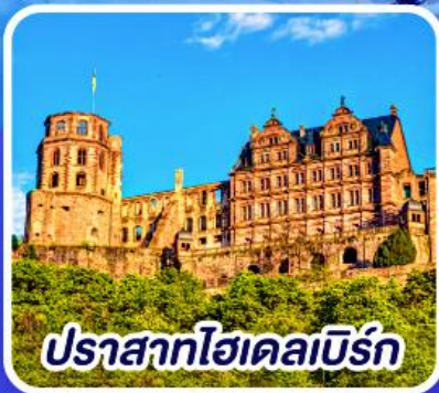
ปราสาทไฮเดลเบิร์ก