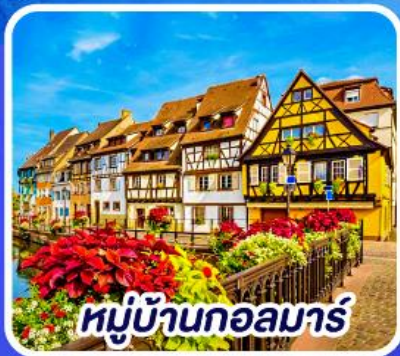
หมู่บ้านกอลมาร์