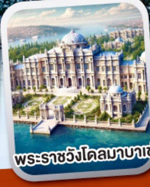
พระราชวังโดลมาบาเช่