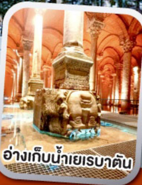
อ่างเก็บน้ำเยเรบาตัน