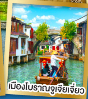
เมืองโบราณจู่เจียเจี้ยว