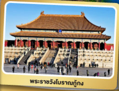
พระราชวังโบราณปักกิ่ง