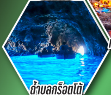
ถ้ำบลูริอตโต้