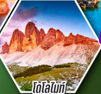
โดโลไมท์

โปรแกรมเดียว เก็บครบจบ อิตาลี ตั้งแต่เหนือถึงใต้