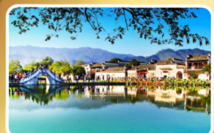
หมู่บ้านผดกโลก หงซุน