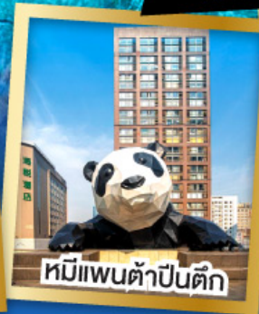
หมีแพนด้าป็นตึก