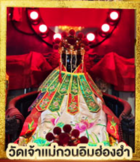
วัดเจ้าแม่กวนอิมฮ่องฮำ