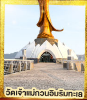
วัดเจ้าแม่กวนอิมริมทะเล