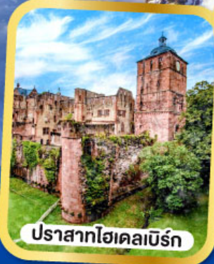
ปราสาทไฮเคลเบิร์ก