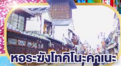
หอรุซังโทคิโนะคานะ