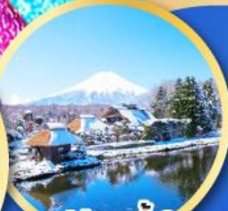
หมู่บ้านน้ำใส โอชิโนะอัทสึ