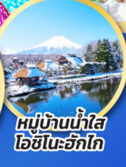
หมู่บ้านน้ำใส โอชิโนะอิวากิ