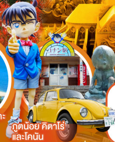
กุนดน้อย คิตาโร่ และโคบัน

เดินทาง 29 ต.ค.-03 พ.ย. 67 12-17 พ.ย. 67 03-08 ธ.ค. 67 (หยุดยาววันพ้อ)