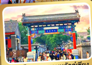
ถนนโบราณหนานหลวู่เกี๋ยง