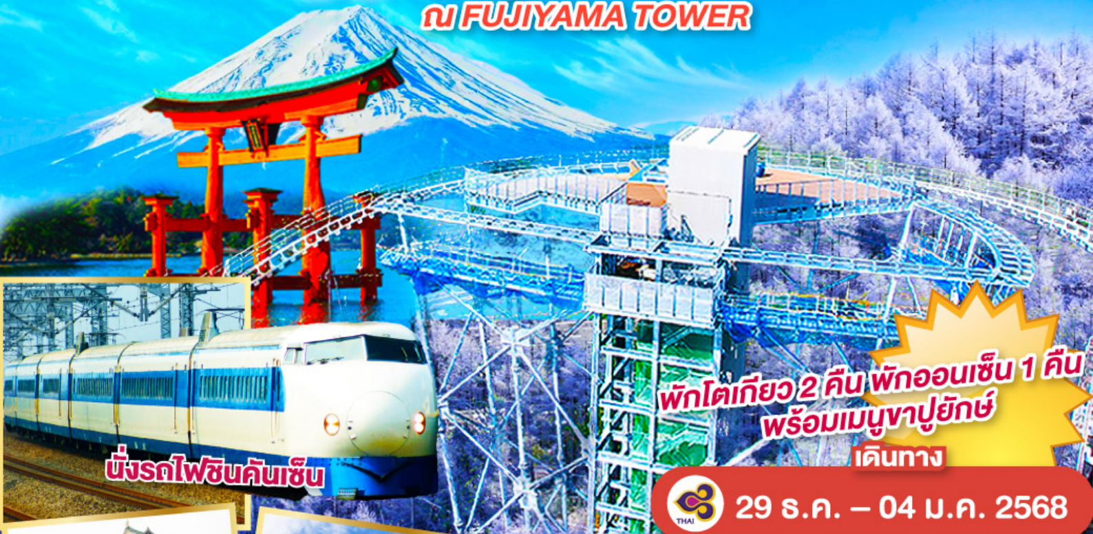
นั่งรถไฟชินคันเซ็น

พักโตเกียว 2 คืน พักออนเซ็น 1 คืน พร้อมเมนูญี่ปุ่น เดินทาง