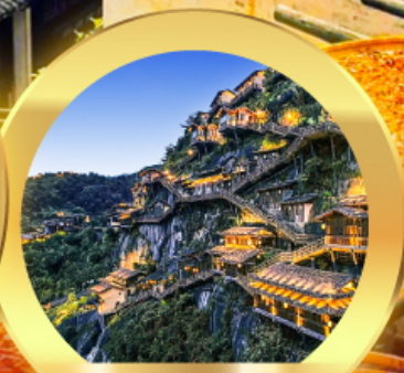
หุบเงาเทวดา