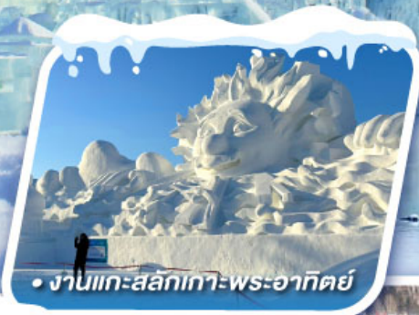
• งานแกะสลักเทวพระอาทิตย์