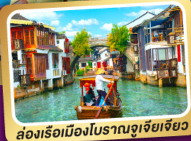
ล่องเรือเมืองโบราณซูเจียเจียว