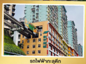
รถไฟฟ้า-ลูตึก