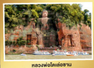
หลวงพ่โตเล่อซาน