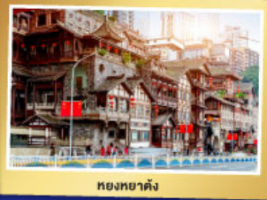
หยงหยาดัง