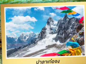
ปาลาก่อง