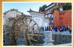
เมืองโบราณแชงกรี่ล่า