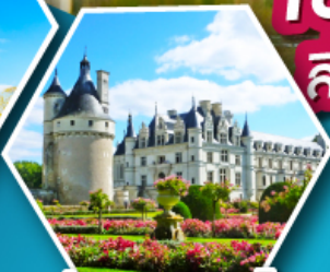
ปราสาทเชอนงโซ

เข้าชมมหาวิหารมรดกแห่งต์มิเชล สิ่งมหัศจรรย์ของประเทศฝรั่งเศส