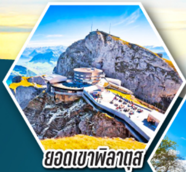
ยอดเขาพิลาตุส