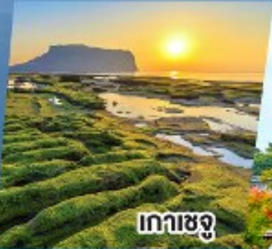
เกาะเซจู