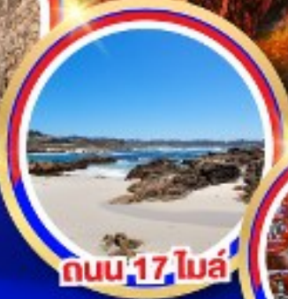
ถนน 17 ไมล์