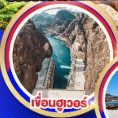
เฟือนฮูเวอร์

ช้อปปีงจุกใจเอ๊าท์เล็ตออนตารีโอมิลล์ ช้อปปีงบาร์สไคว์เอ๊าท์เล็ต