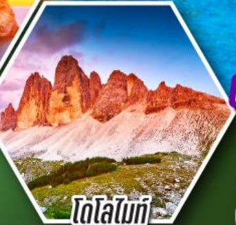
โตโลไมท์