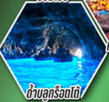
ถ้ำบลูกร็อตโต