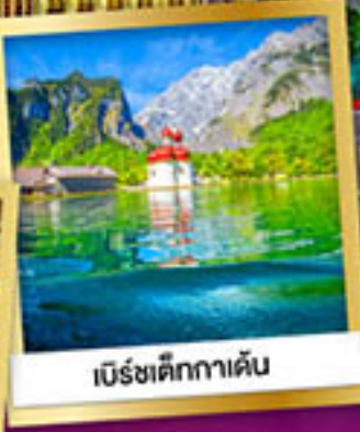
เบียร์ตีตกาคาเดิน