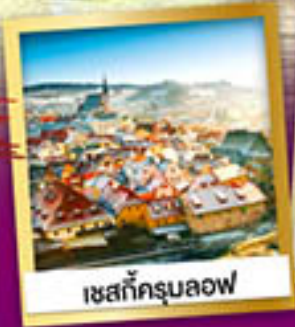
เซสท์ครูนลอฟ