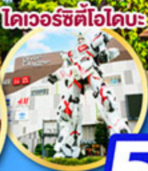
โดเวอร์ซิตีไอบะ