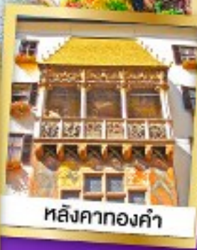
หลังคาทองคำ