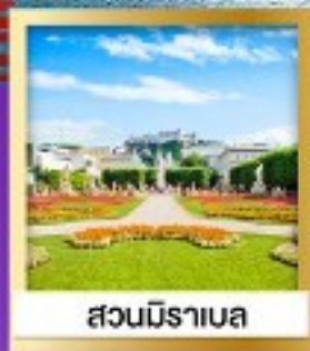
สวนมิราเบล