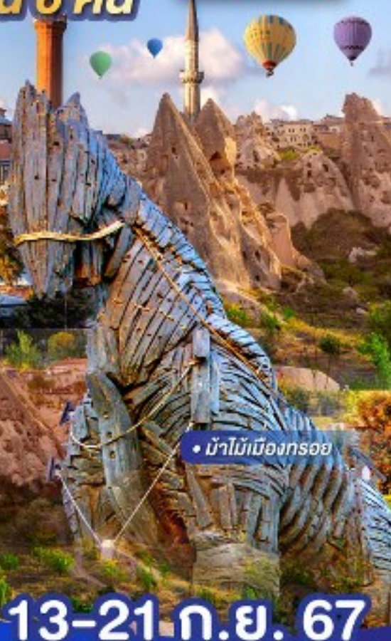
• นำไม้เมืองทรอ