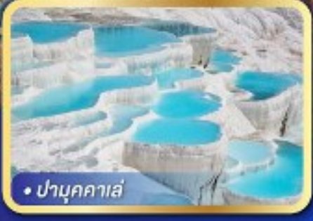
• ปามุกคาเล่