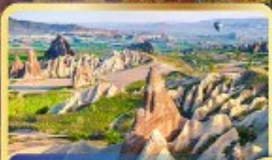
• หุบเขานกฟิรา