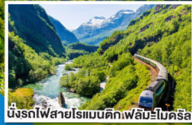
นั่งรถไฟสายโรแมนติกเฟลัมโบโคร์