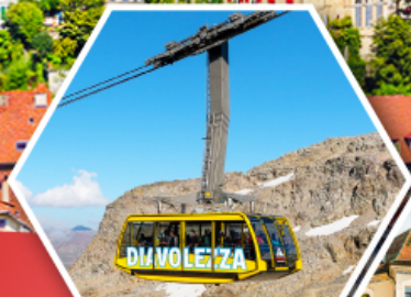
กระเช้าดีอาโอเลซซา

11-18 ต.ค.67 18-25 ต.ค.67 08-15 พ.ย.67 03-10 พ.ย.67