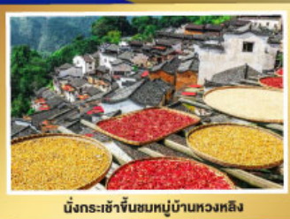
มังกรระชาจีนชมหมู่บ้านทวดหลิง