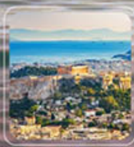
Piraeus (Athens) Greece

เที่ยวประเทศ GREECE – TURKEY 2 ประเทศ 8 เมือง