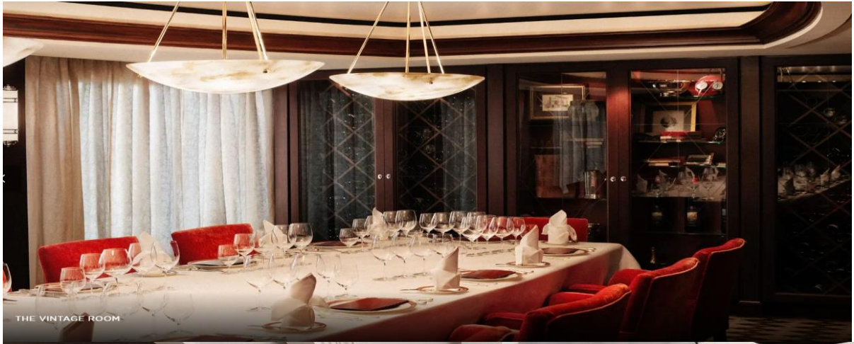
THE VINTAGE ROOM