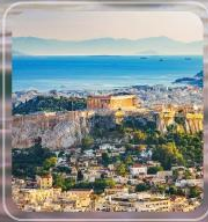
Piraeus (Athens) Greece

เที่ยวประเทศ GREECE – TURKEY 2 ประเทศ 8 เมือง