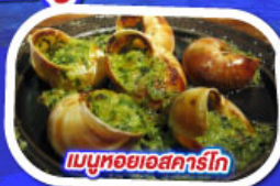
เมนูหอยแอสคาร์โท

ทานอาหาร ณภัตตาคารบนหอไอเฟล พร้อมชมวิวแสนโรแมนติก เมนูหอยแมลงภู่อบไวน์ขาว