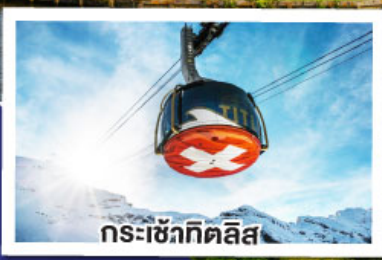
กระเช้าทิตลิส