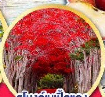
อุโมงค์เมเปิ้ลแดง ณ สวนลับฮิราโอคะ