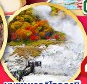
หุบเขานรกจิกุกุคาบิ