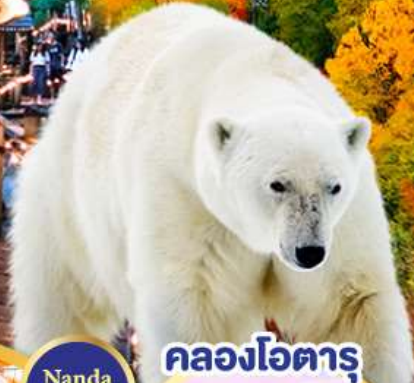
คลองโอดารุ