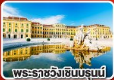
พระราชวังซินบรุนน์