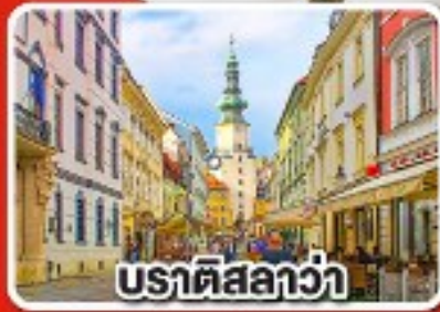
บราติสลาวา

เที่ยวเมือง คาร์โลวารี เมืองแห่งสปา พร้อมเมนูพิเศษเปิดโบฮีเมีย