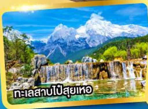
ทะเลสาบไป๋สฺยเหอ