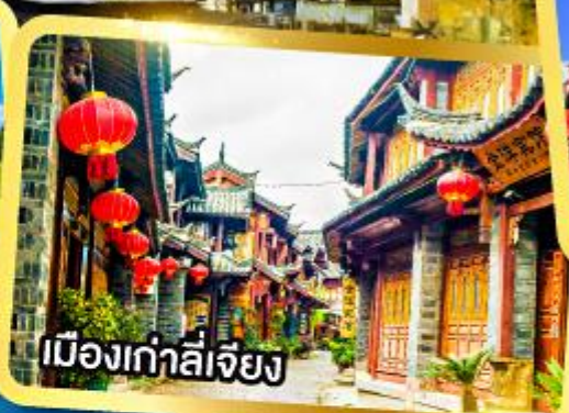
เมืองเก่าลี่เจียง