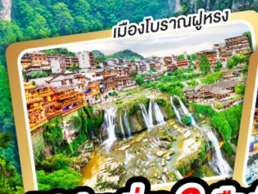
เมืองโบราณฝูหยง