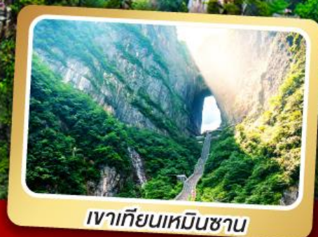
เวาเทียนเหมินซาน

ทริปเดียวเที่ยว 2 เมืองโบราณ ฝูหลงและเฟิ่งหวง ลิ้มรส สุกี้เด็ด ปังย่างเกาหลี เปิดบักกิ้ง